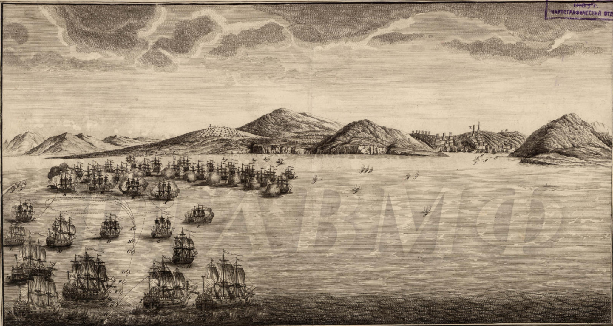
ПЛАНЪ МОРСКАГО СРАЖЕНІЯ МЕЖДУ РОССІЙСКИМЪ ФЛОТОМЪ ПОДЪ ПРЕДВОДИТЕЛЬСТВОМЪ ЕГО СІЯТЕЛСТВА ГРАФА АЛЕКСѢЯ ТРИГОРЬЕВИЧА ОРЛОВА И ОТТОМАНСКИМЪ ФЛОТОМЪ 5 го ІЮЛЯ 1770.