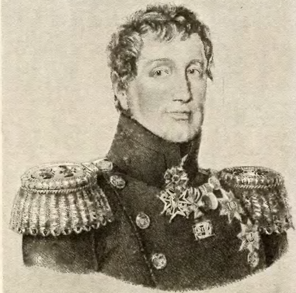
Адмиралъ А. В. фонъ-Моллеръ. Въ 1812 г. командовалъ Балтійскимъ Гребнымъ флотомъ.