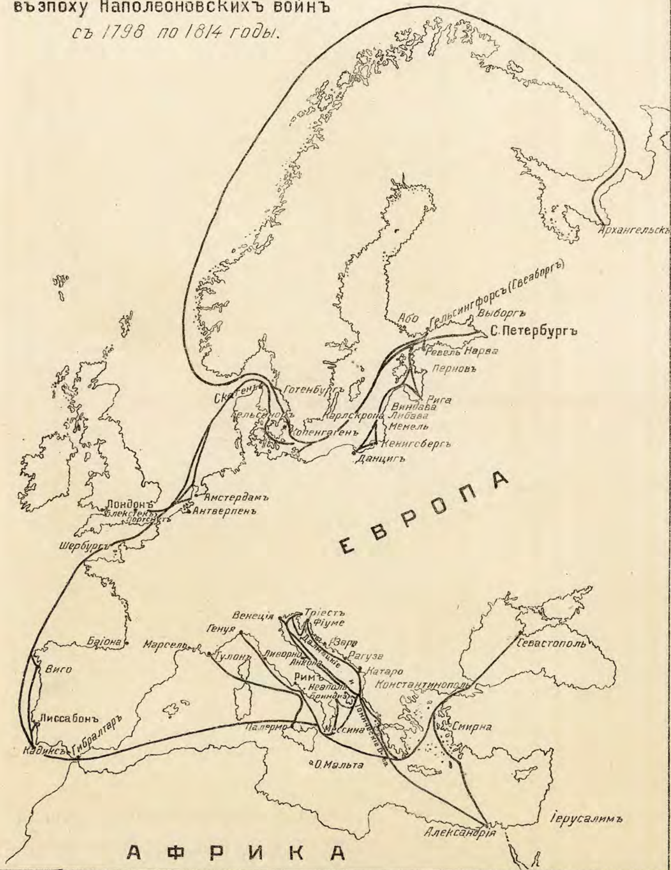
Схема главнѣйшихъ передвиженій русскаго флота въ эпоху Наполеоновскихъ войнъ съ 1798 по 1814 годы.