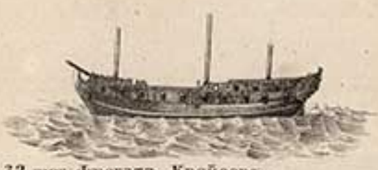
32 пуш. фрегатъ Крейсеръ. 1723.