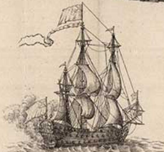
64 пуш. корабль Москва. 1715.