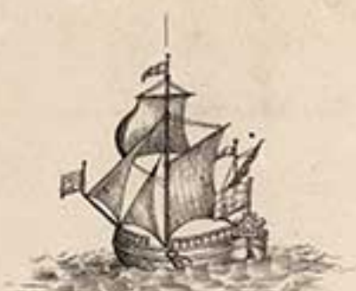
Буеръ Люстихъ. 1704.