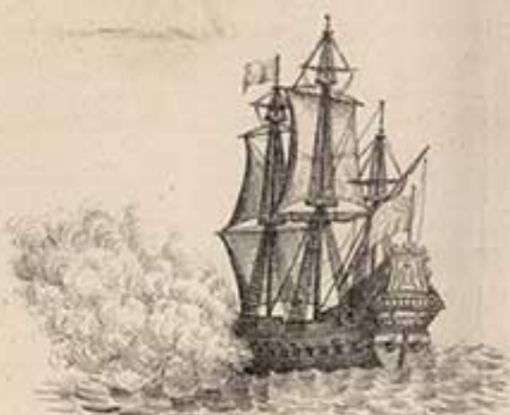
32 пуш. корабль Олифантъ. 1705.