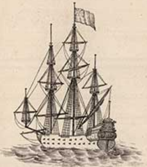
70 пуш. корабль Лефермъ. 1713.