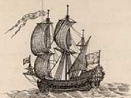
28 пуш. корабль Кроушлотъ. 1704.