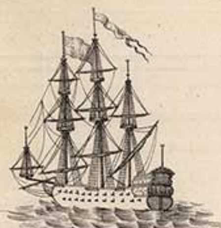
64 пуш. корабль Ингерманландъ. 1715.