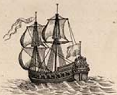
44 пуш. шлюпа Мункеръ. 1704.