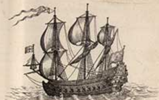
32 пуш. корабль Думкратъ. 1707.