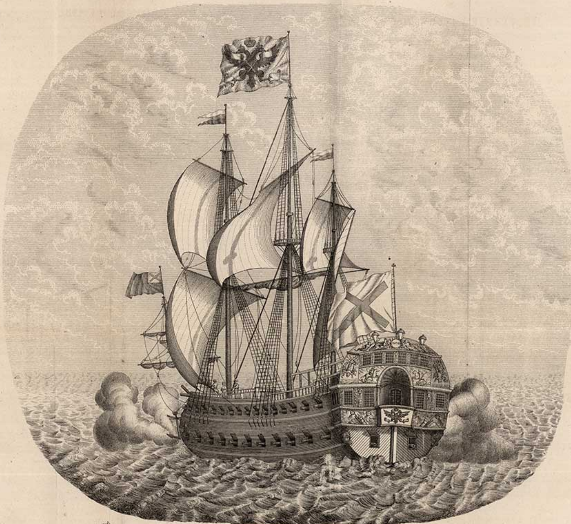
54 ПУШ. КОРАБЛЬ ПОЛТАВА. 1712.