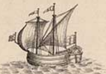
Флейтъ Патриархъ. 1704.