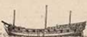
24 пуш. шлюпъ Принца Александръ. 1716.