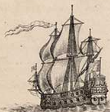
28 пуш. корабль Архангелъ Михаилъ. 1702.