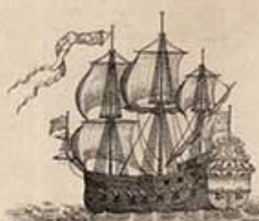
28 пуш. корабль Дефамъ. 1704.