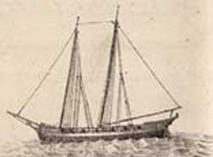
Яхта Транспортъ Роща. 1697.